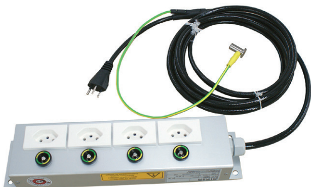
Multiprese ospedaliere involucro in alluminio

Le prese multiple ospedaliere sono state specificamente sviluppate per gli ospedali per il trattamento di patologie acute con sale operatorie e stazioni di terapia intensiva. Nelle sale operatorie si possono alimentare vari apparecchi elettrici medicali mediante prese multiple. Vi offriamo due diversi corpi esterni a scelta, un involucro in alluminio e una cassetta in gomma dura tipo 1400. Questi corpi esterni sono dotati di prese T13 e di boccole di messa a terra. Come cavo di alimentazione si usa un cavo GIFAS per apparecchi ospedalieri.