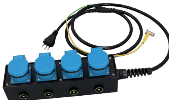
Multiprese ospedaliere gomma dura