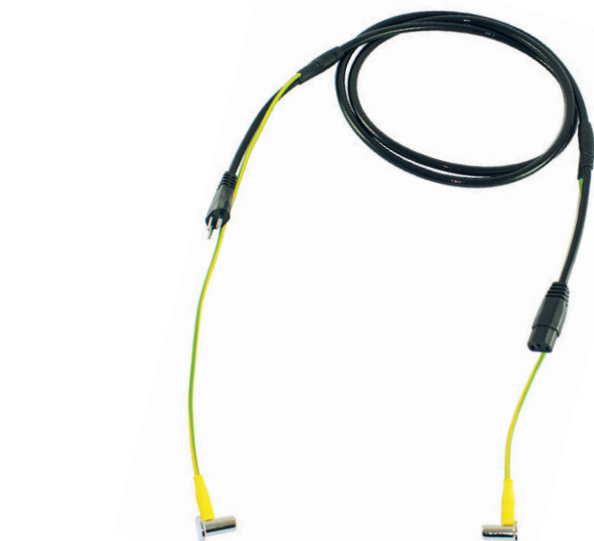
Cavo ospedaliero con connettori T12/T113 vulcanizzati

per installazioni elettriche in ambienti per uso medico. (SN SEV 1000 -2000, capitolo 7.10)